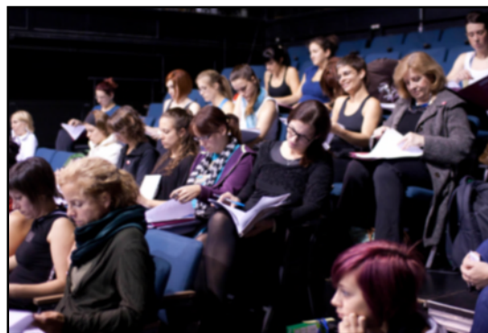
Journées de Formation 2011 de l'AQEDÉ.